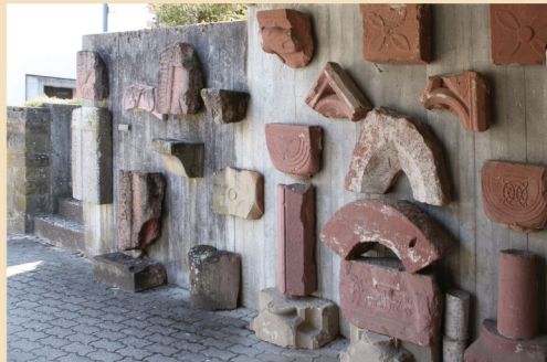
Diese Fragmente von Epitaphien und hochwertiger Bauausstattung der Klosterkirche finden sich etwas versteckt an einer Wand auf deren Nordseite.

Obwohl das Kloster in mehr als 40 Dörfern über Einkünfte und Grundbesitz verfügte, geriet es ab Mitte des 14. Jahrhunderts in eine ökonomische Krise. Am Ende des 16. Jahrhunderts bestand der Konvent nur noch aus einer einzigen Nonne.