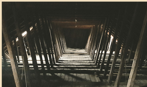
Blick in das Holzgerüst des über 800 Jahre alten Dachstuhls. Gegen die Dachfläche geneigte Querbünde unterstützen die Sparrenkonstruktion.